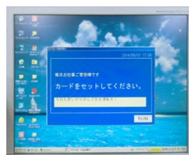
デジタルタコグラフ読み取り端末