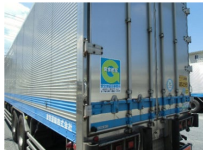
全車両に貼られている認定マーク